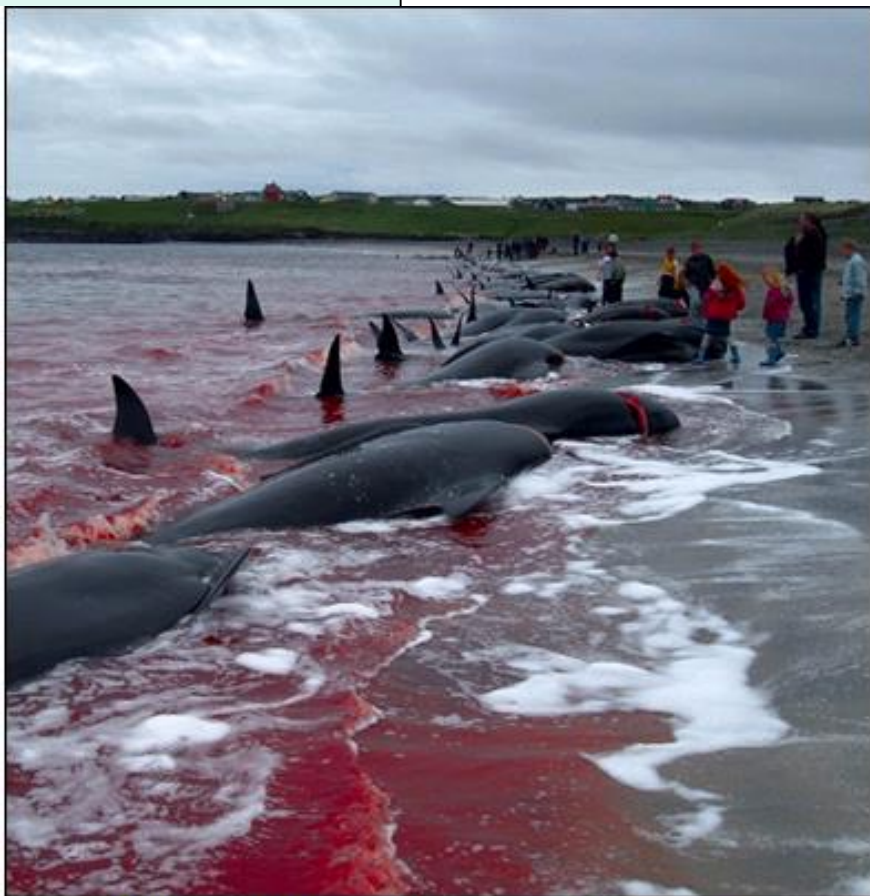
Tradicionalni vsakoletni izlov kitov na Ferskih otokih