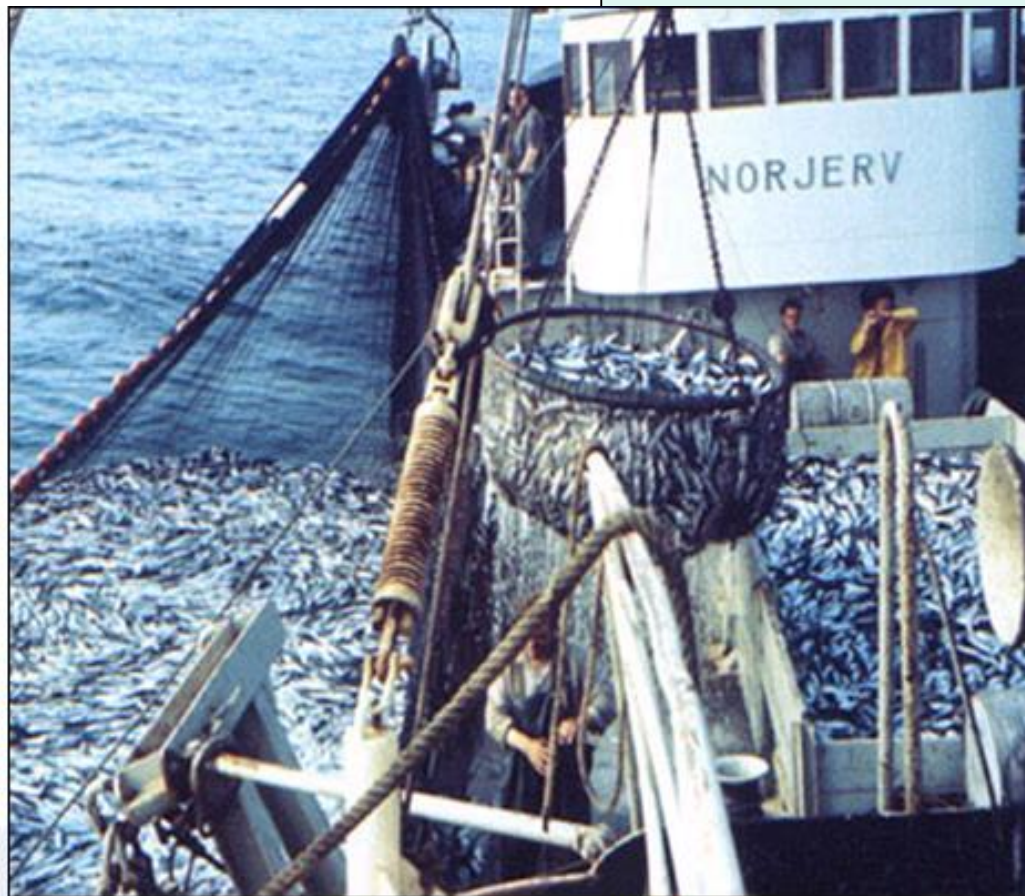
Bogat ulov norveških ribičev