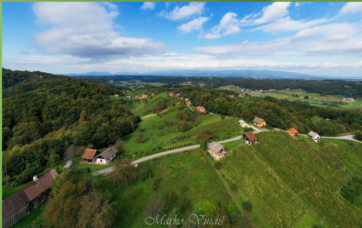
Haloze, razložena naselja