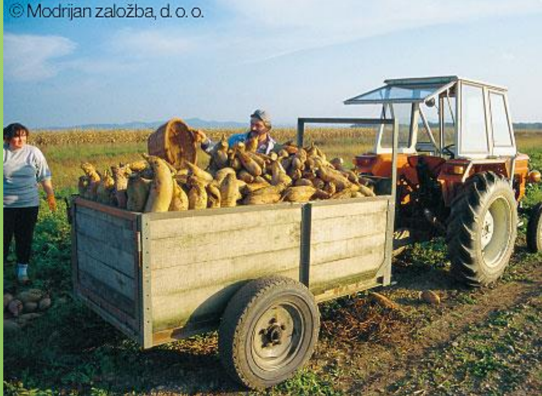
Spravilo pridelka na Dravskem polju