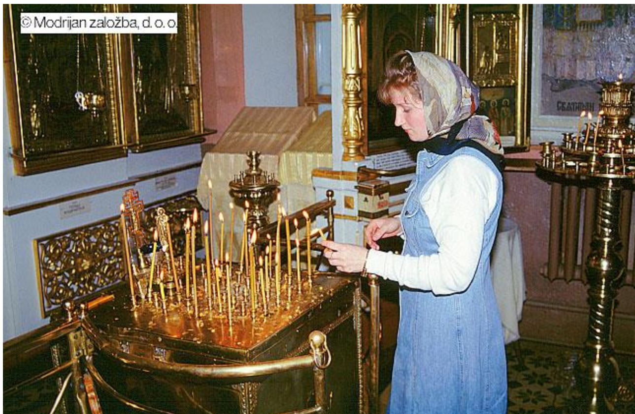
Prižiganje svečke v ruski pravoslavni cerkvi