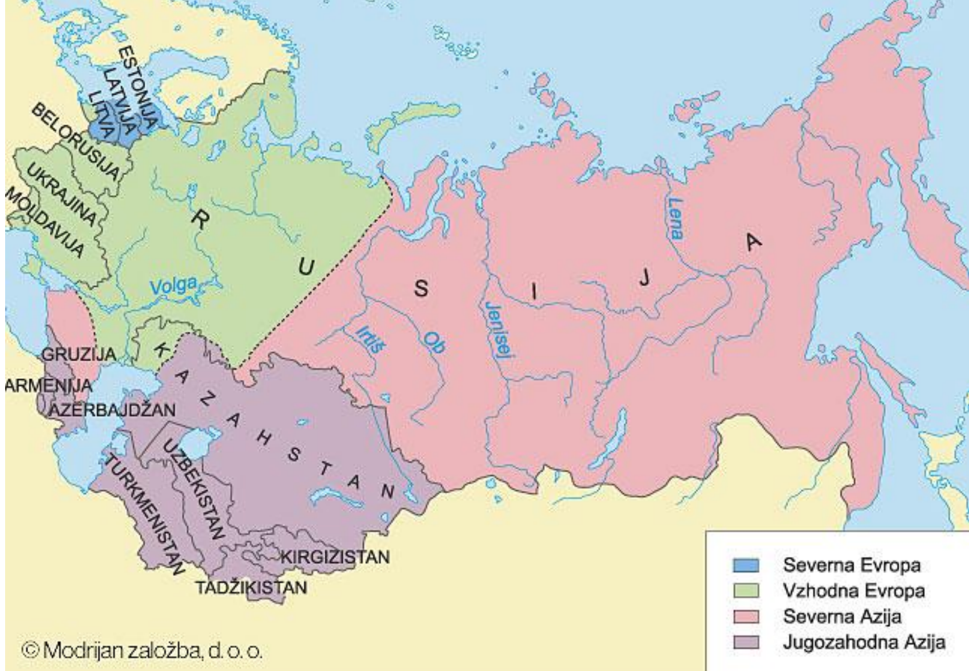
Današnje geografske enote na ozemlju nekdanje Sovjetske zveze