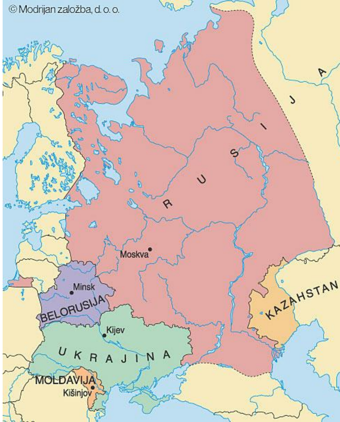
Države Vzhodne Evrope in njihova glavna mesta