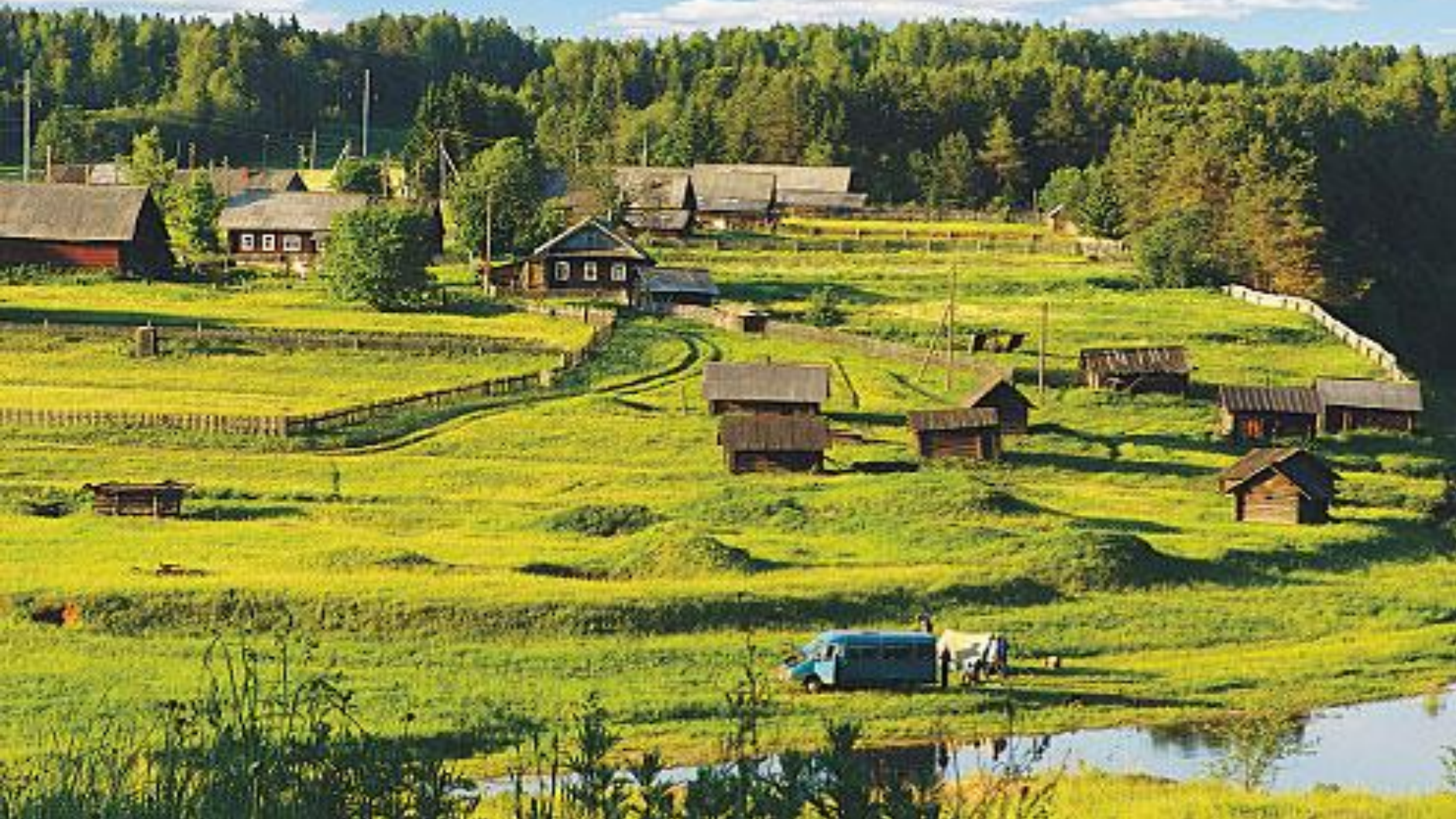
Značilna ruska vas v evropskem delu Rusije