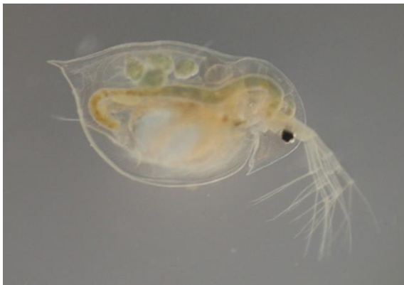
VODNA BOLHA (sladkovodni rak)