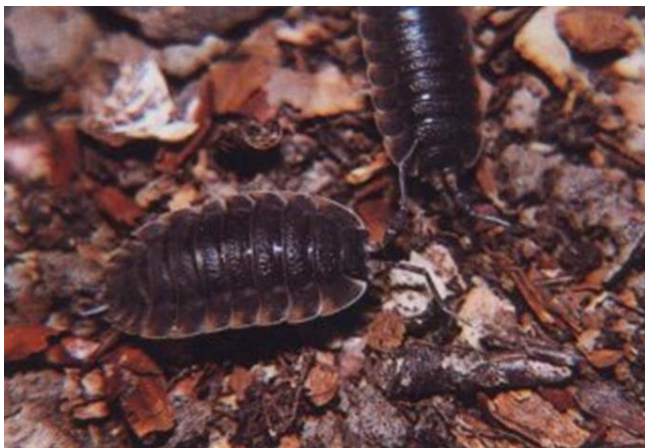
MOKRICA (kopenski rak)