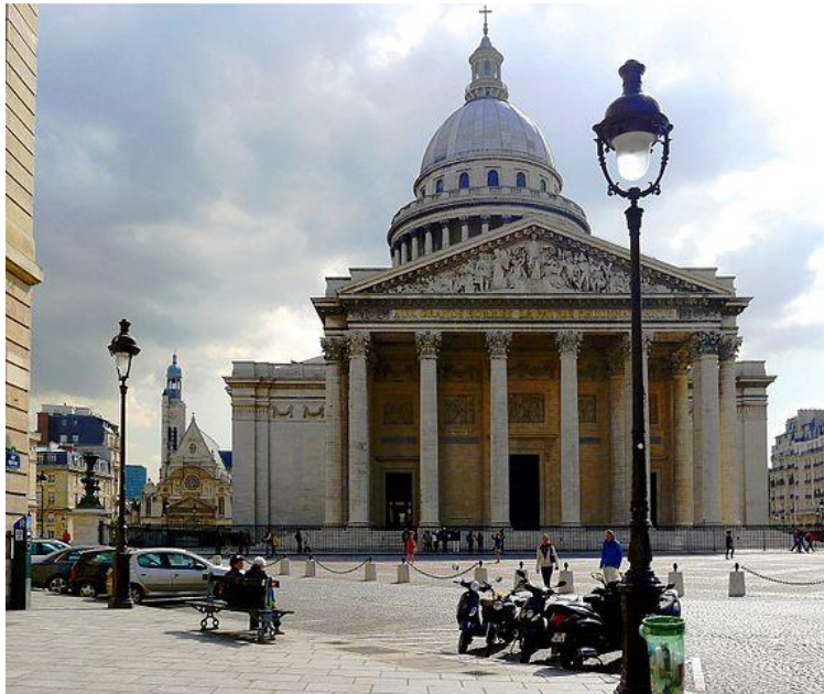
Jacques-Germain Sufflot, 1758–1789, Panteon, Pariz, Francija

V arhitekturi neoklasicizma se zrcali splošni ideal antične umetnosti. Nastale so nove, monumentalne javne zgradbe, kot so muzeji, gledališča in podobno. Značilno je simetrično oblikovanje zgradb ter uporaba antičnih arhitekturnih elementov , kot so klasični stebri in redi.