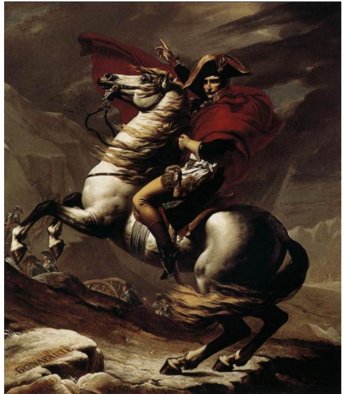
Jacques Louis David, leto 1800, Napoleon na prelazu sv. Bernarda