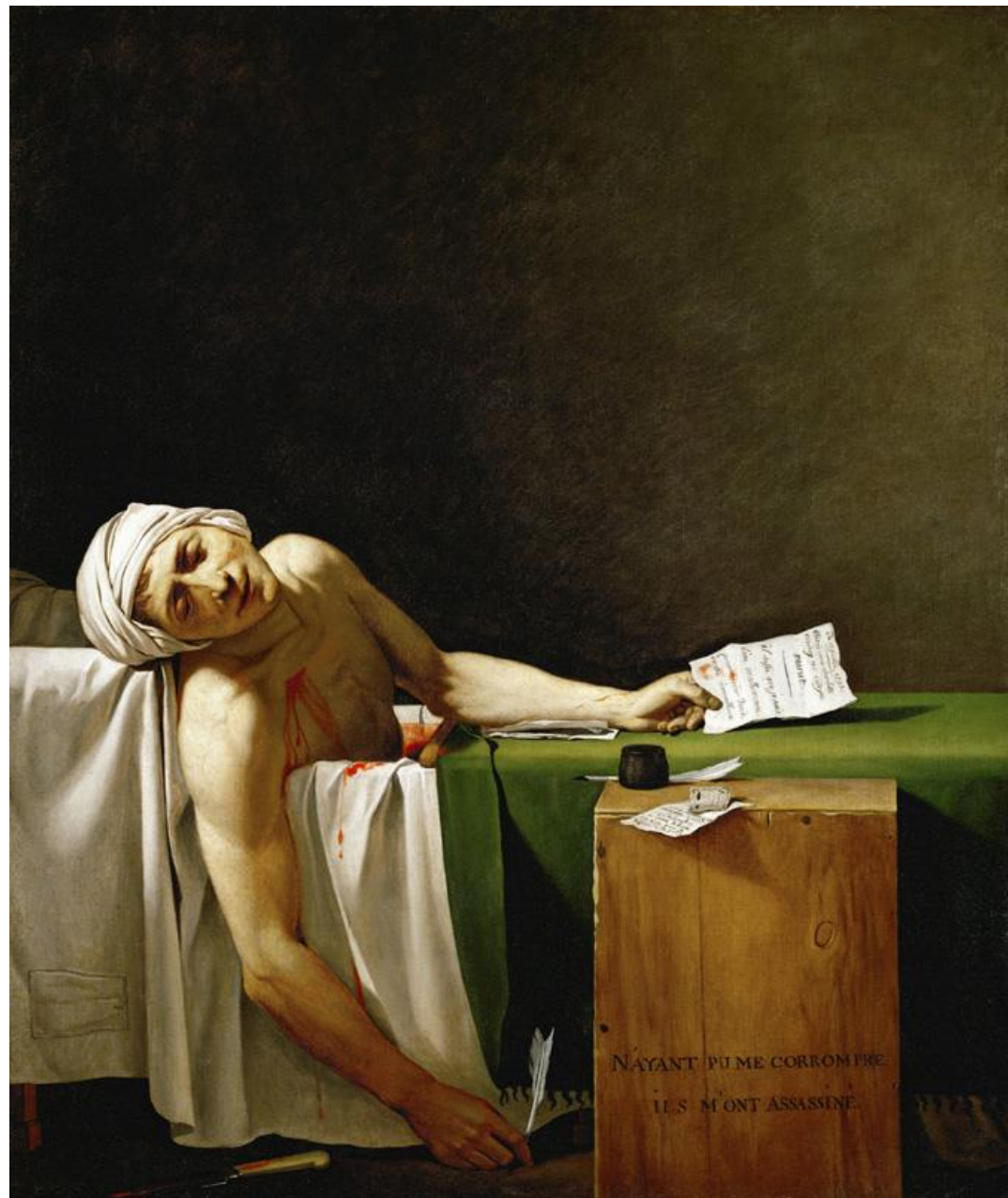
Jacques Louis David, leto 1793, Umorjeni Marat