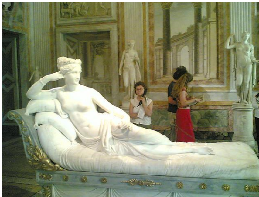
Antonio Canova, leto 1808, Paolina Borghese