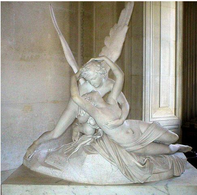
Antonio Canova, 1786–1793, Amor in Psihe

Antonio Canova (1757–1822) je najpomembnejši predstavnik neoklasicističnega kiparstva in je s svojim slogom vplival na vse kiparske izdelke 19. stoletja. Najbolj so ga zanimala antične, mitološke teme, s katerimi je sporočal moralne nazore svojega časa.