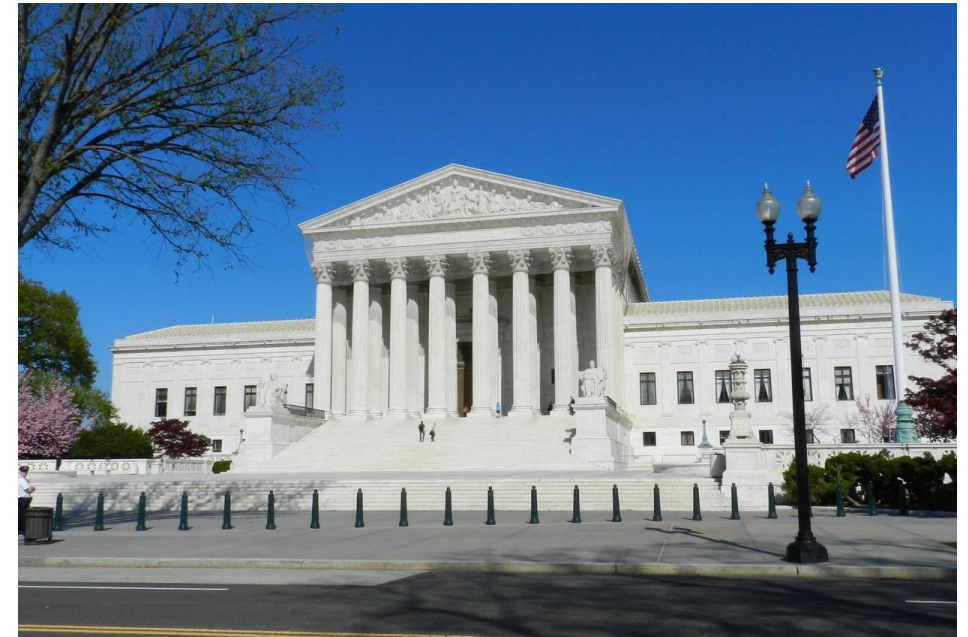
Pierre-Charles L'Enfant, 1791–1793, Kapitol, Washington DC, ZDA