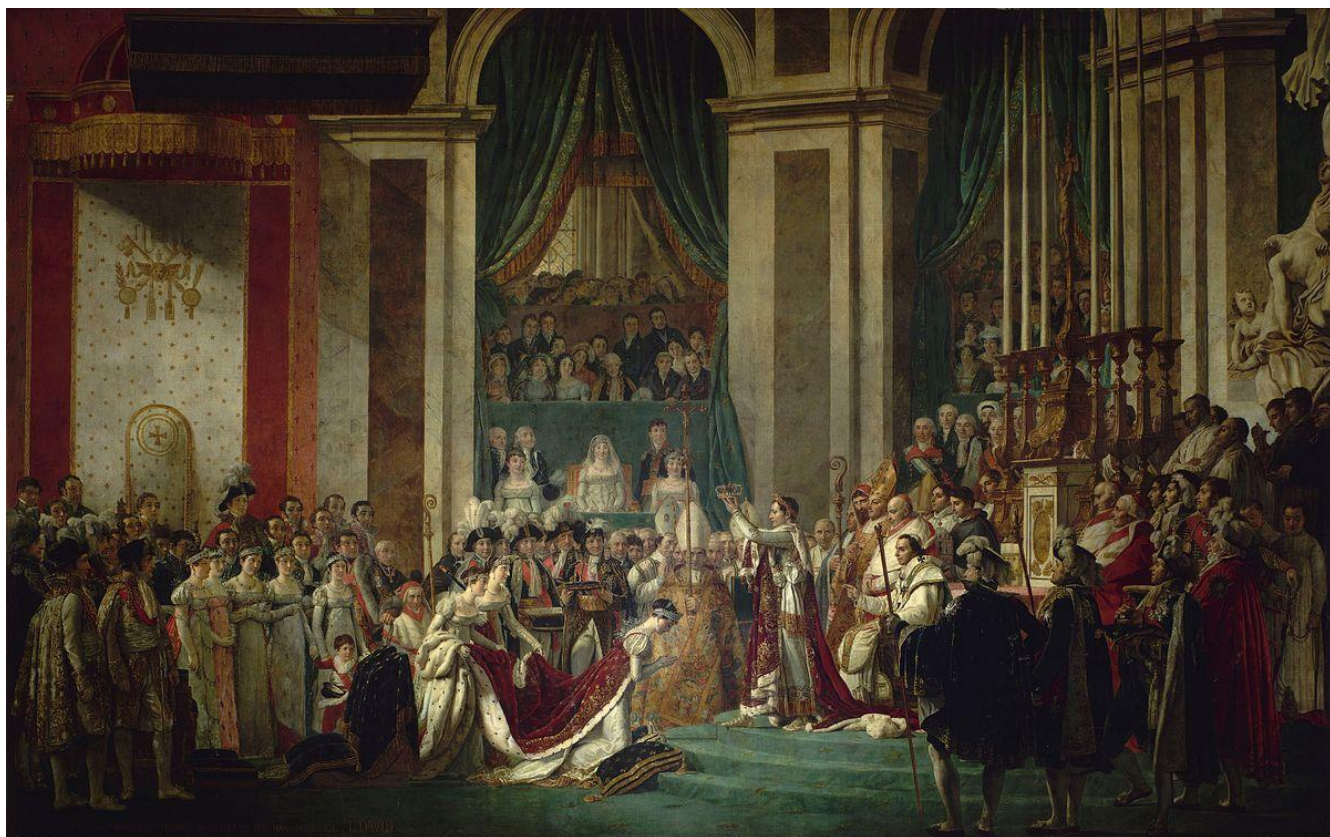
Jacques Louis David, 1805–1807, Kronanje Jožefine