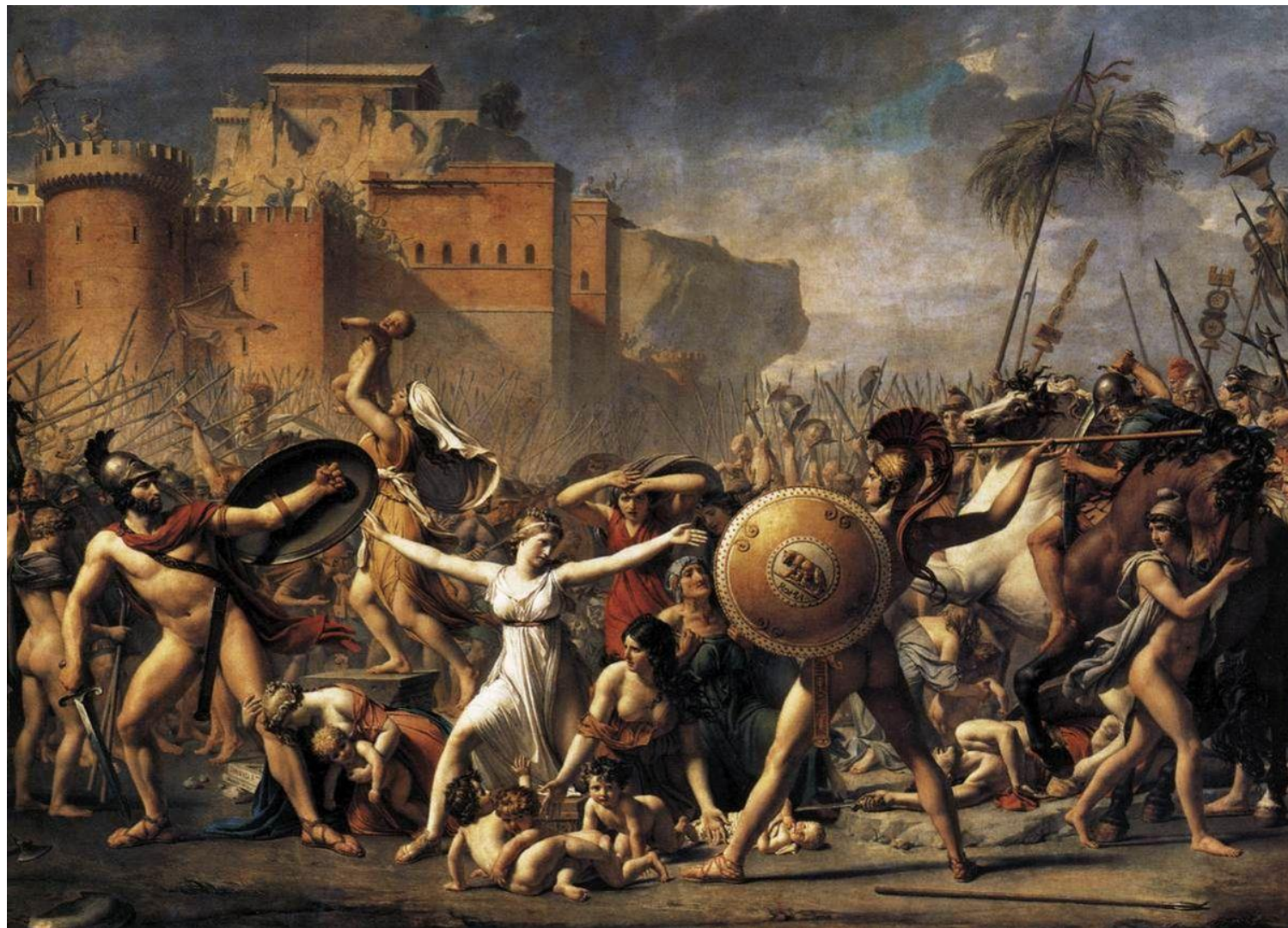
J. L. David, leto 1799, Intervencija Sabink

Baročni slikarji so slikali predvsem religiozne teme ( naročnik je bila Cerkev ), neoklasicisti pa so poleg religioznih tem , ki imajo sporočilno vlogo, najraje slikali mitološke prizore .