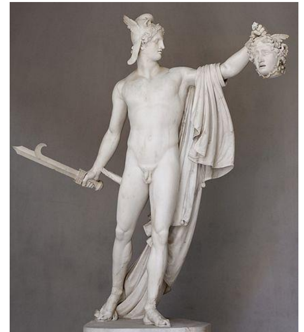
Antonio Canova, leto 1800, Perzej z Meduzino glavo