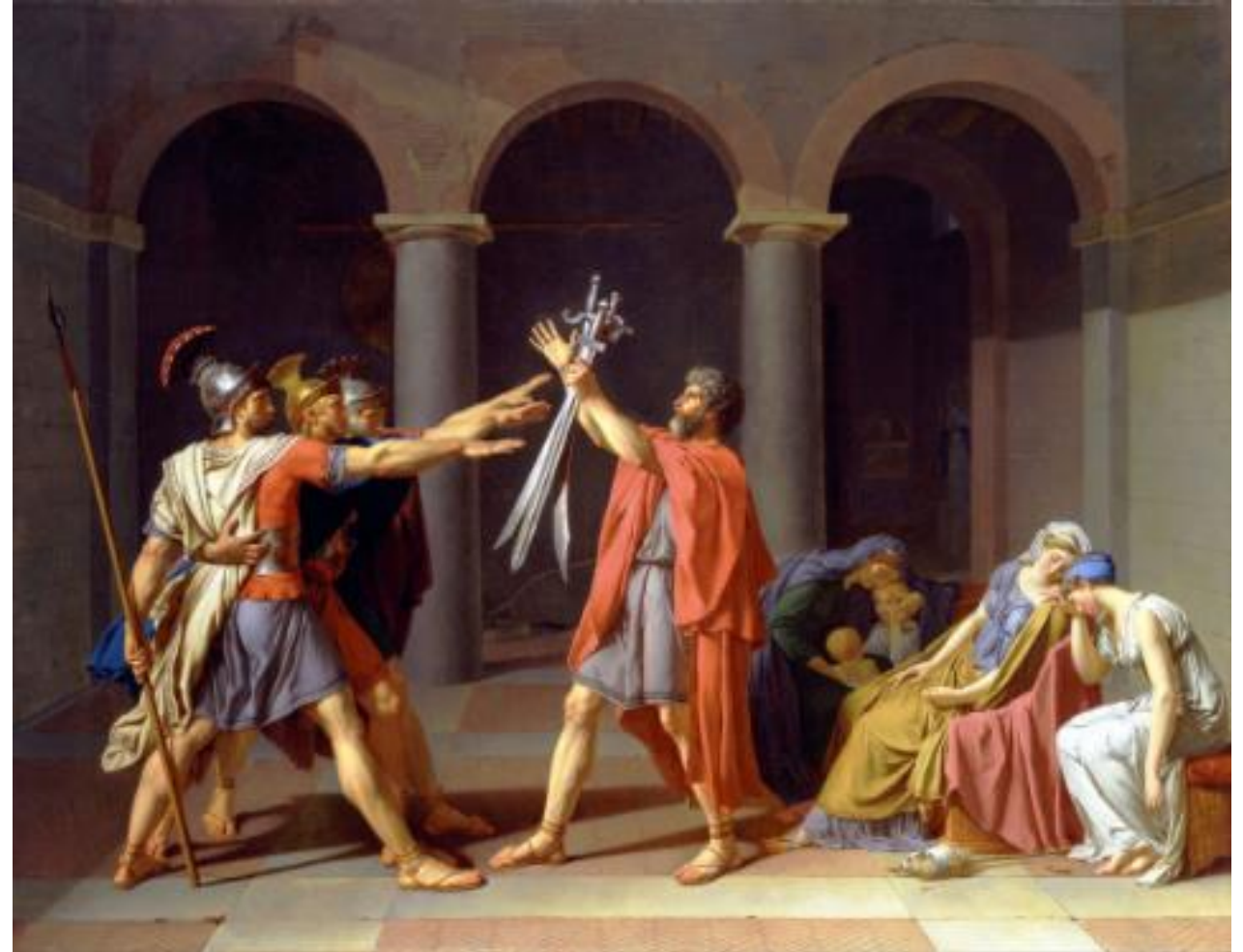
Jacques Louis David, 1784–1785, Prisega Horacijev