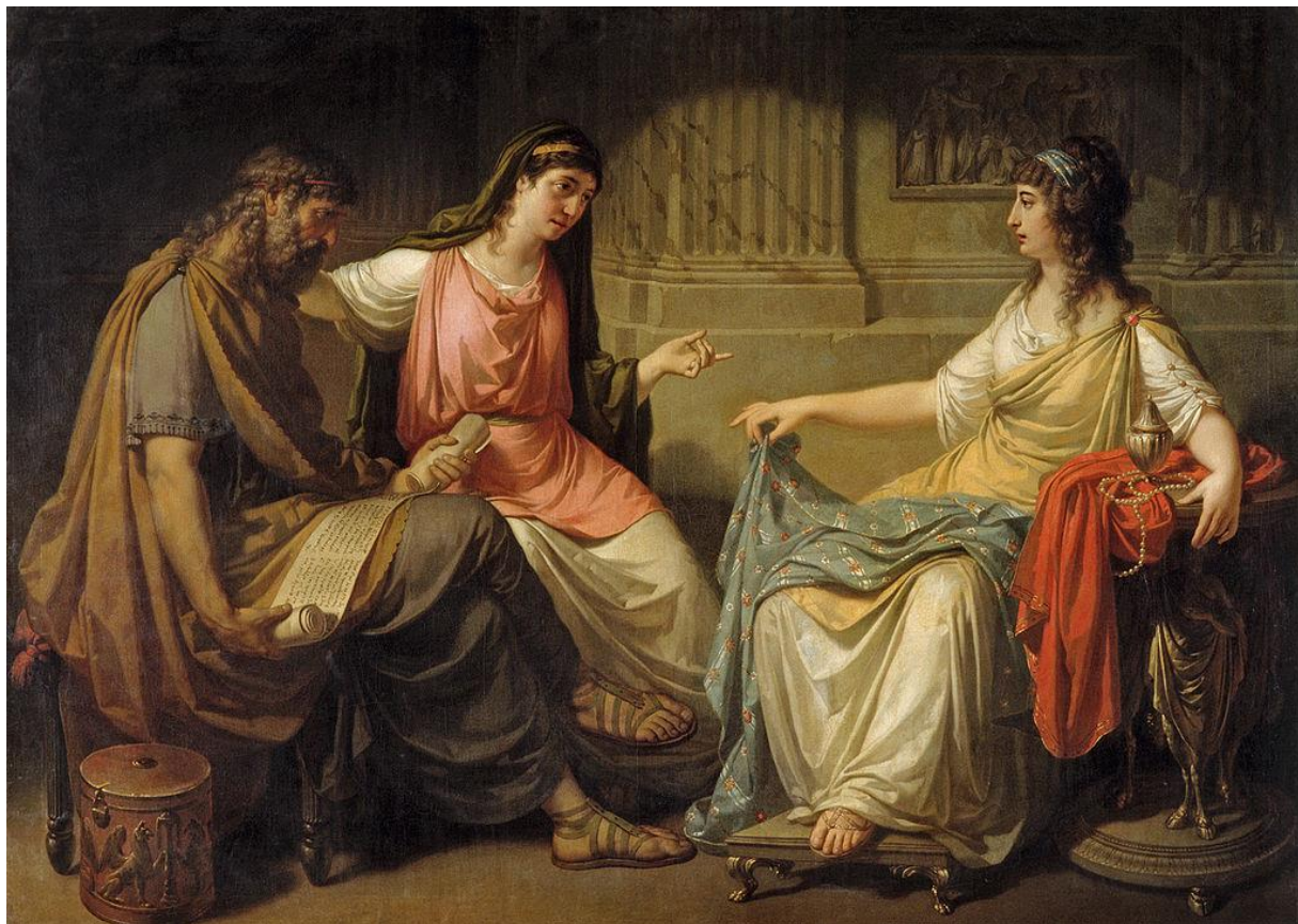
Franc Kavčič, leto 1801, Fokion z ženo in bogato Jonko

Šolal se je na Dunaju, slikarsko znanje pa je dopolnjeval v drugih umetnostnih središčih. Znamenite so predvsem njegove monumentalne mitološke podobe.