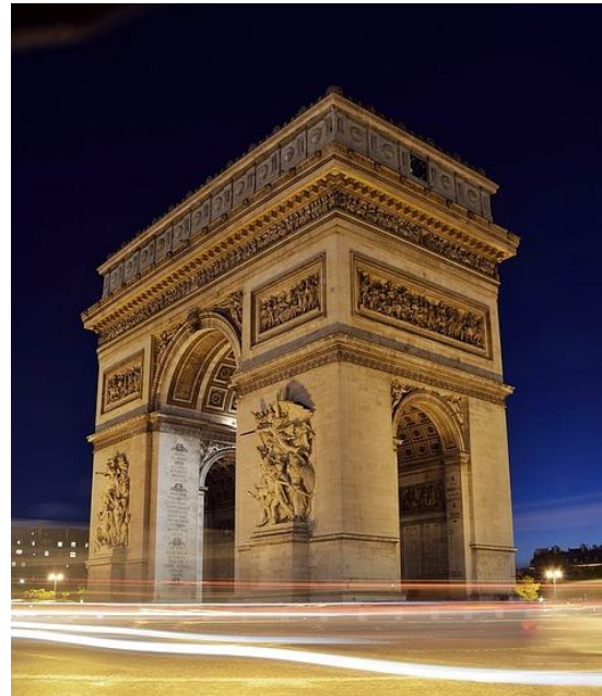
Charles Percier, Léonard Fontaine, 1806–1836, Slavolok zmage, Pariz, Francija