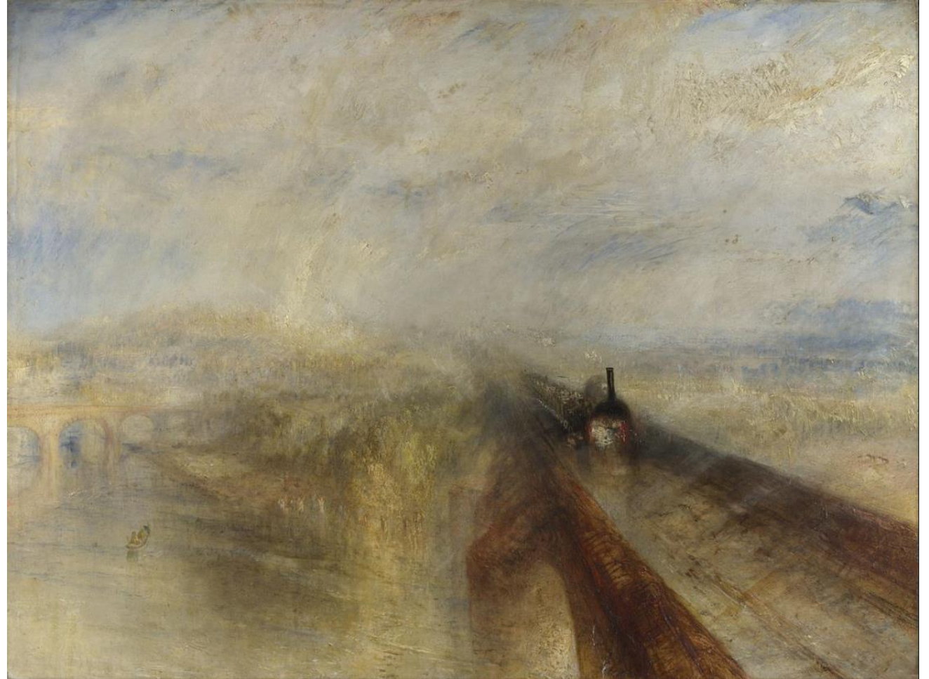
William Turner, leto 1844, Dež, para in hitrost