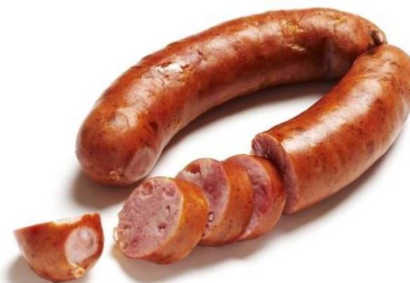
Kranjska klobasa Vir