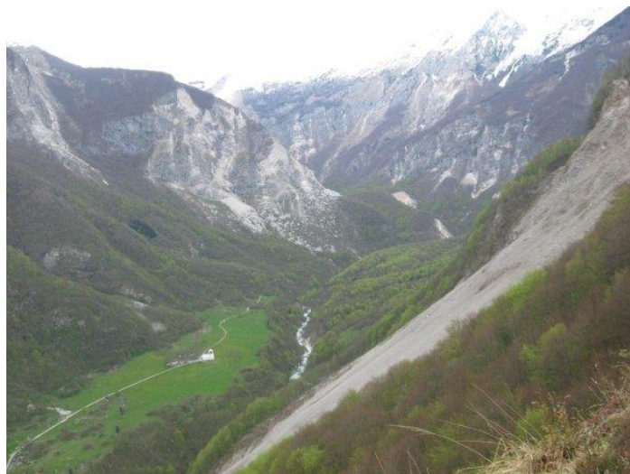
Pogled iz Čadrga.