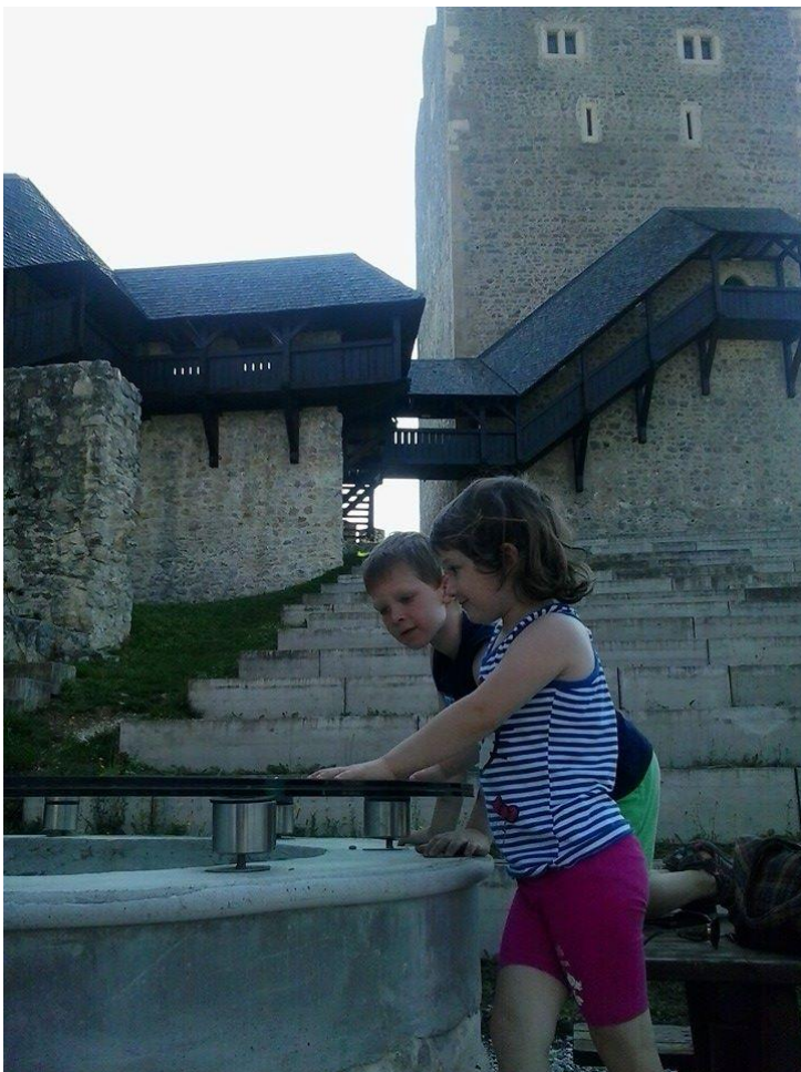
Na Celjskemu gradu.