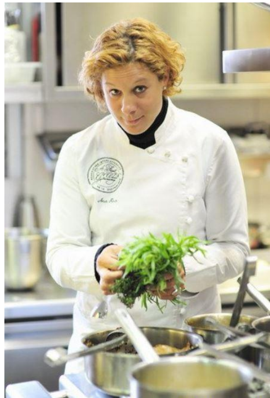
Ana Roš Vir