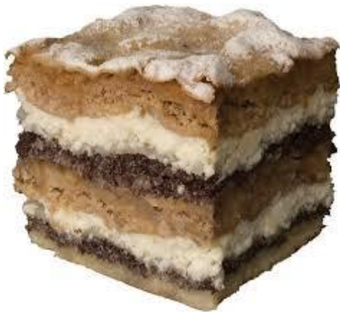
Prekmurska gibanica Vir

Slovenija je tudi zaradi kulinarike na svetovnem turističnem zemljevidu.