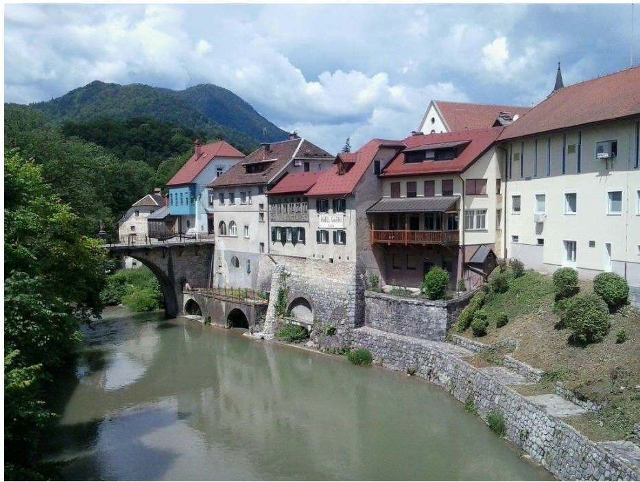
Škofja loka, staro jedro Avtor: PŠ