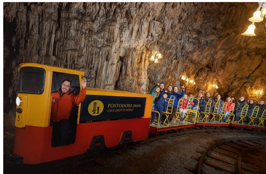
Postojnska jama Vir