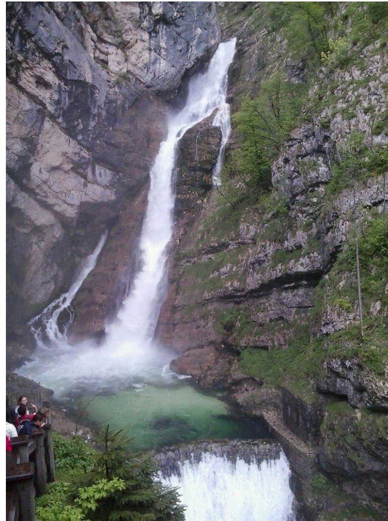
Slap Savica.