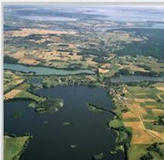
Mazursko pojezerje Vir