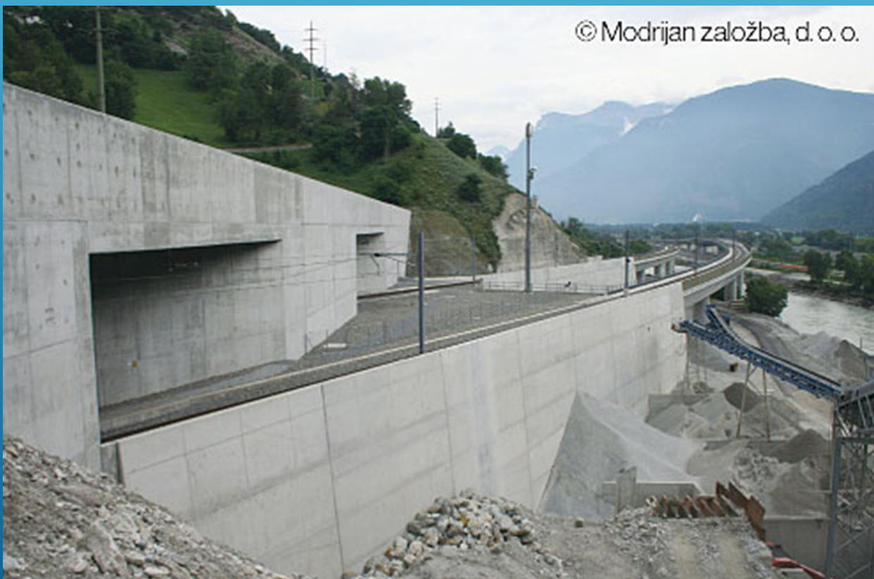
Vhod v več deset kilometrov dolg predor Lötschberg v Švici.