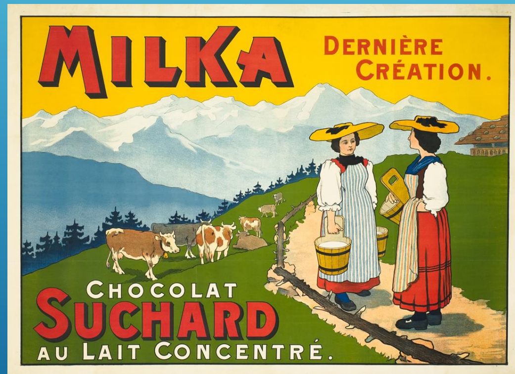
Milka, Švica Vir