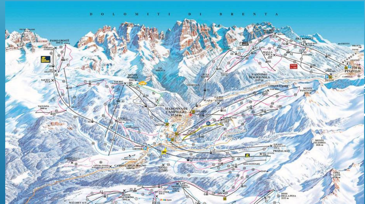
Smučišče Madonna di Campiglio