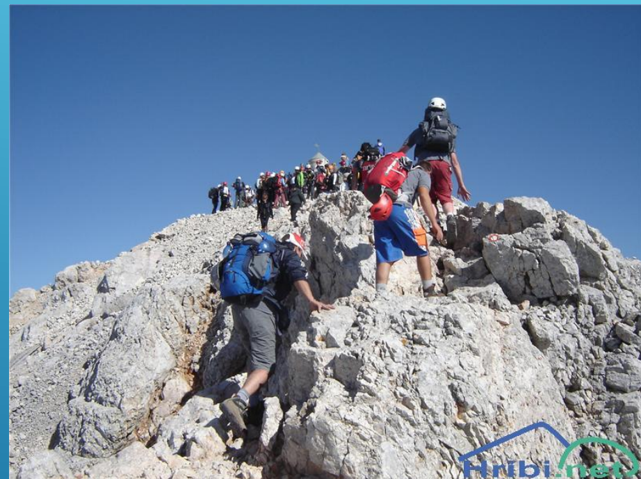
Množičen turizem na Triglavu Vir