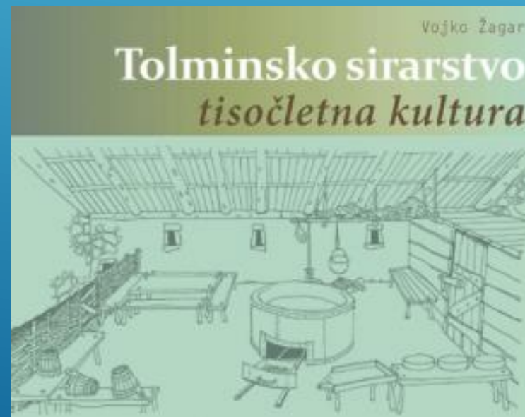
Sirarska tradicija Vir