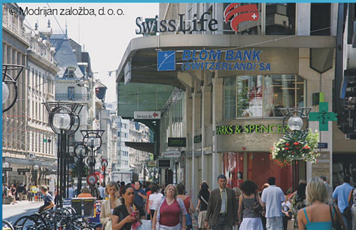
Poslopje švicarske banke v Ženevi.