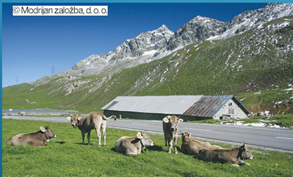
Visokogorski pašniki v Švici.

Najpomembnejša je živinoreja, katere posebnost je PLANINSKO PAŠNIŠTVO . Pozimi je živina v hlevih v dolinah, poleti pa na višje ležečih planinskih pašnikih. Zaradi sočne paše so mleko in mlečni izdelki zelo kakovostni (sir, čokolada).