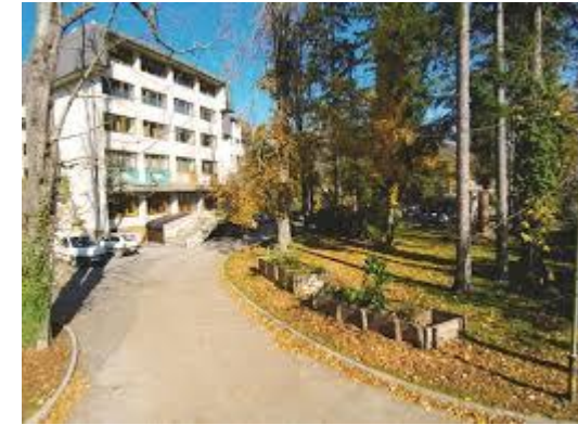
Bogata, stoletna tradicija gospodarjenja z gozdom.