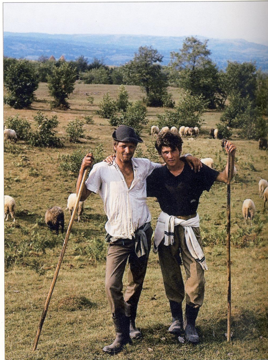
Južni Karpati v Romuniji. Pastirja paseta drobnico.