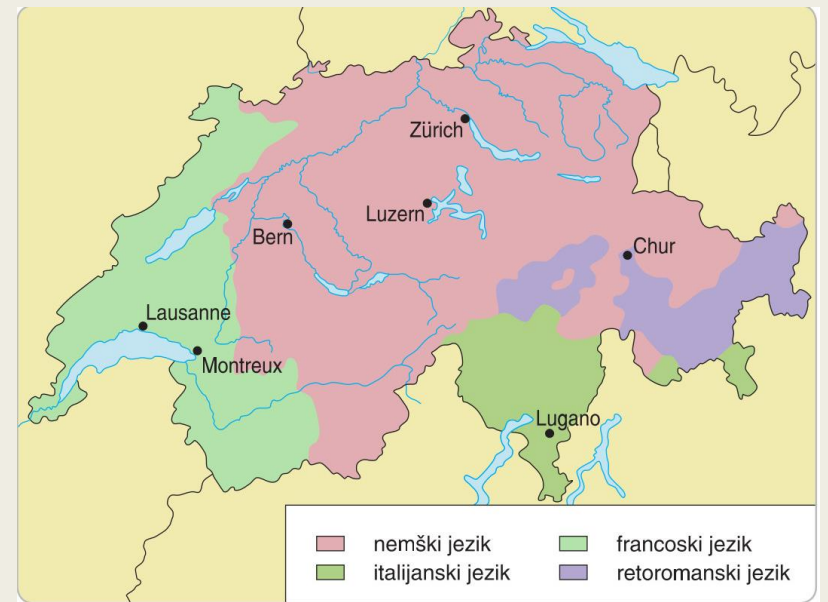
Jezikovna območja v Švici.