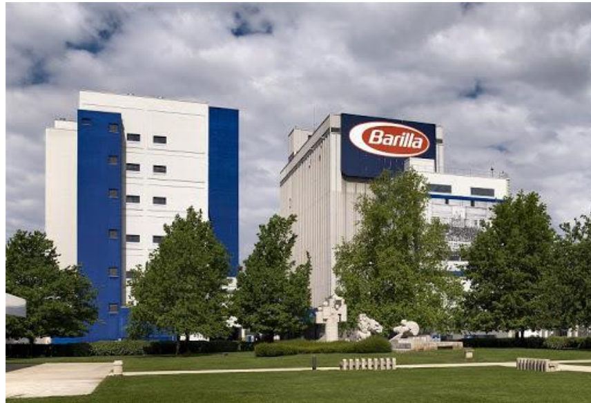
tovarna Barilla – testenine v Parme