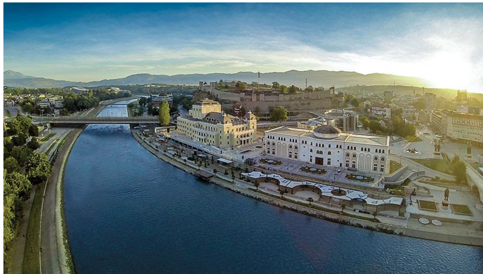
Vardar v Severni Makedoniji