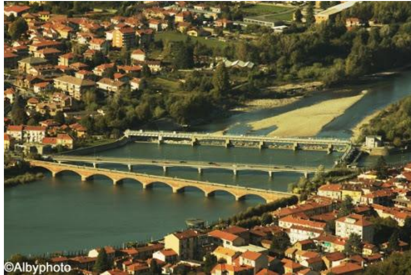
reka Po ali pad