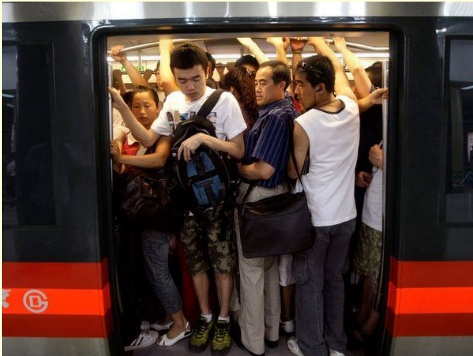
Jutranja gneča na postajah