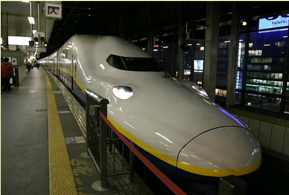
shinkanzen – hiter vlak