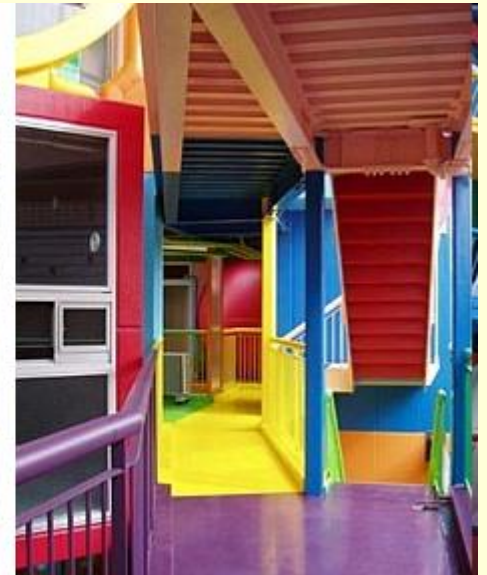
tradicionalna in moderna arhitektura