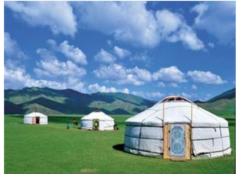
Mongolske stepe in jurte – prebivališče nomadov