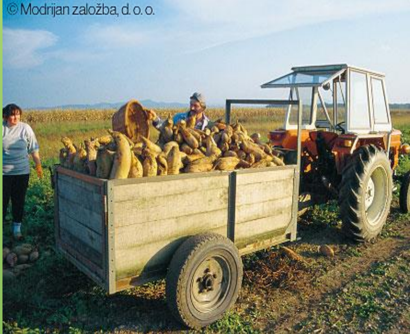
Spravilo pridelka na Dravskem polju